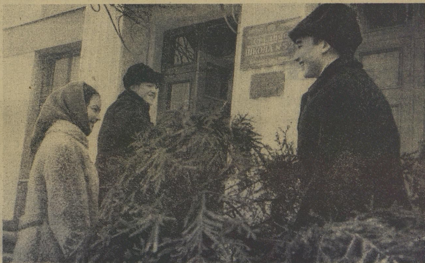
Новогодняя ёлка для школы...

Год издания 44-й | Пятница, 27 декабря 1968 г. | Цена 1 коп.